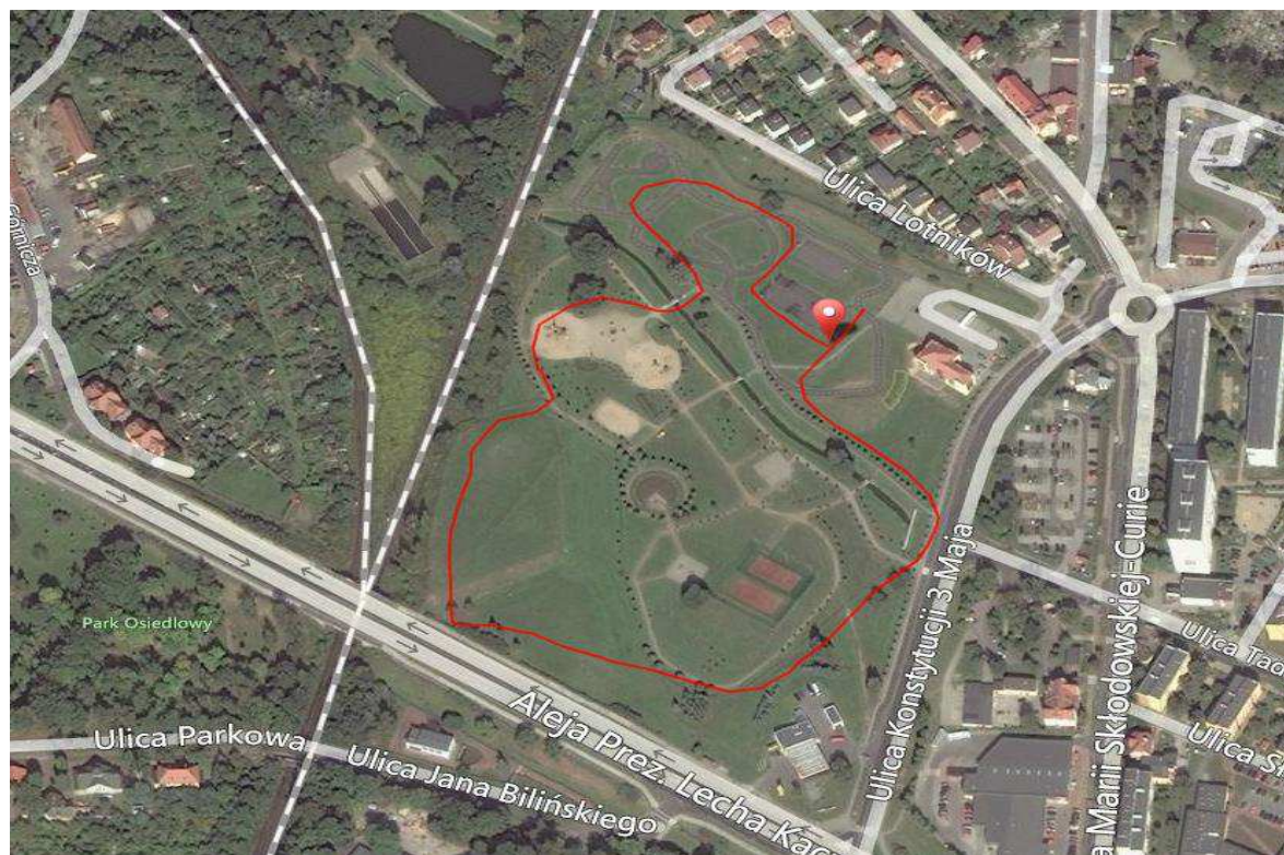
Rzut satelitalny trasy Młodzieżowych Mistrzostw Polski w biegach przełajowych